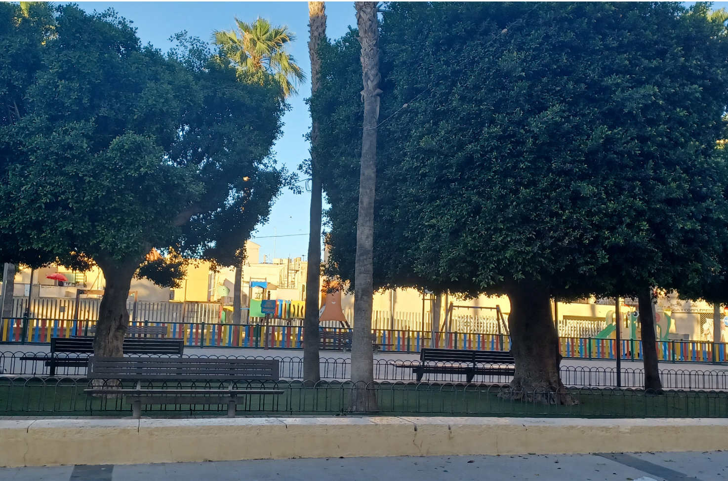
Parque del Recreo, punto neurálgico de encuentro de la sociedad cuevana y las familias.