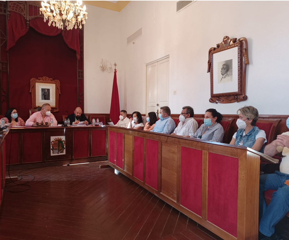
Pleno en el que se aprobó el suplemento para realizar la actuación en la rambla.

El Ayuntamiento de Cuevas del Almanzora y la Confederación Hidrográfica del Segura (CHS), dependiente del Ministerio de Agricultura, Alimentación y Medio Ambiente del Gobierno de España, convenían la solución para que las barriadas de Grima y El Largo no queden aisladas cada vez que llueve. Algo que se ve agravado por que la pedanía de Grima dispone de un único acceso que queda cortado cuando la lámina de agua de la rambla de Las Canalejas supera la rasante del actual camino existente, dejando impracticable el paso y evidenciando la necesidad de arreglar el problema y garantizar la conexión de ambas márgenes de la rambla. Por ello, a solicitud del Ayuntamiento cuevano, se plantea la formalización de un convenio de colaboración para sustituir el actual paso existente por una nueva que soporte mayores caudales de la rambla. Se proyecta así la construcción de una obra de drenaje transversal en el cauce de la rambla de las Canalejas, a través de varios marcos de hormigón con las dimensiones adecuadas para permitir el correcto desagüe de la rambla a su paso por este punto y el paso, en condiciones de seguridad, de